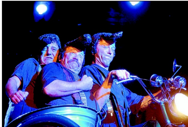
Neutjesrang promoveerde van doctorandus naar doctor.